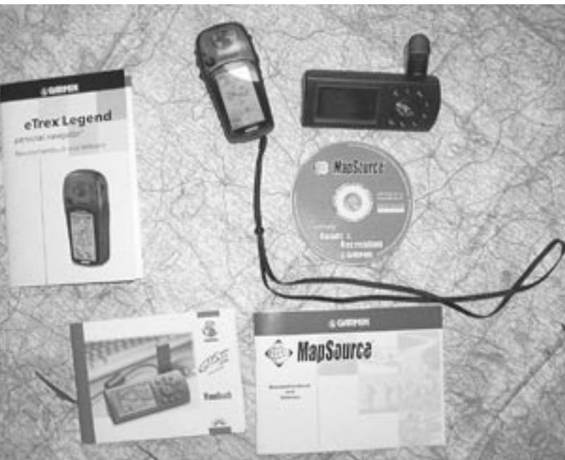
Jede Menge Zubehör: MapSource-CD mit Kartendaten und Manuals für Garmin eTrex und GPS III plus

auflösende Display vom eTrex Legend ist mit Abstand Klassenbester, das bezieht sich auf alle hier genannten Geräte. Summit hat ein ähnlich grobes Display wie GPS III plus, ist aber immer noch ausreichend: Sie bieten alle 4 Graustufen und verschiedene Menüführungen. Legend ist fast komplett mit deutschsprachiger Software und Menüführung ausgestattet. Dazu gibt es noch Programmpunkte, die Sonnen- und Mondzeiten (Aufgang /