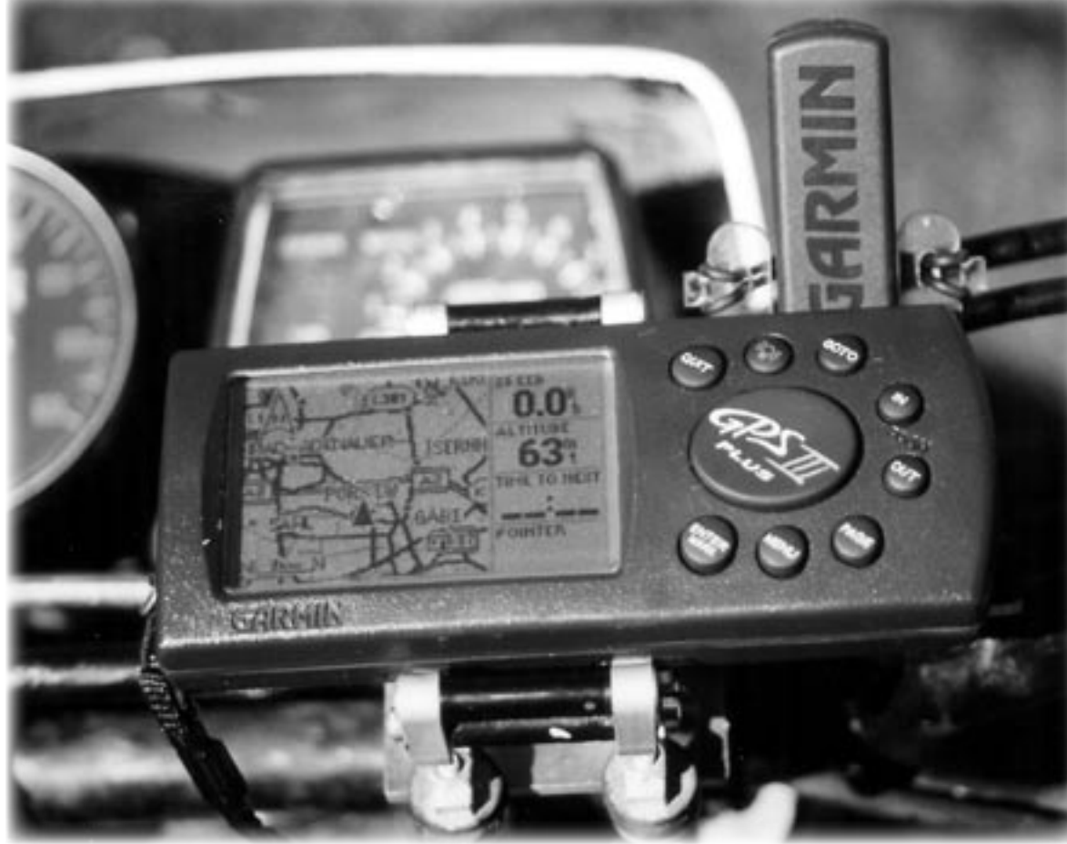
Garmin GPS III plus mit Motorradhalterung von Globetrotter: absolut wetterfest.