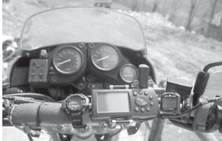
Oben und rechts: Die exakt gefertigte Halterung ermöglicht eine optimale Anbringung des GPS III am Motorrad.