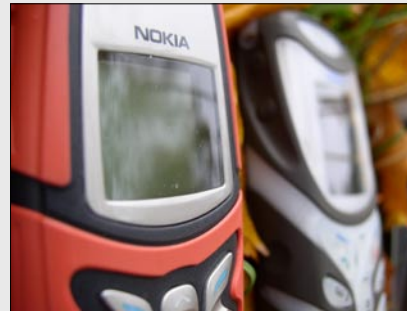
Nokia 5210 und 5100