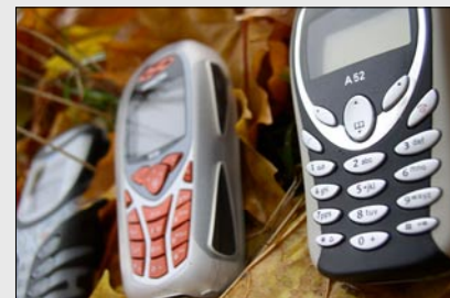
Siemens M55 (mitte) A52 (rechts)