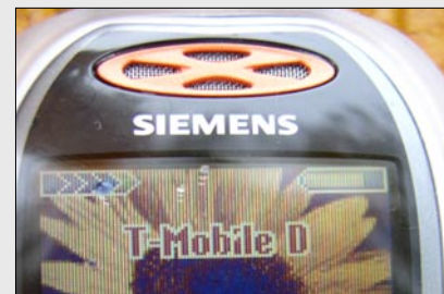
Farbdisplay Siemens ME 55