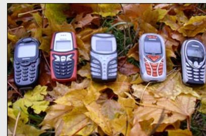
Modelle auf dem Markt: rechts Aussenseiter A52