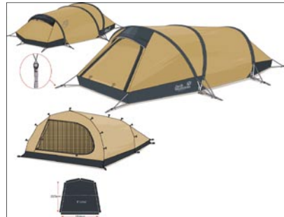
NEU 2004 | Jack Wolfskin Shelter GT