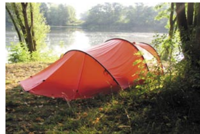
Nallo 4 GT | angenehm Leicht im Sommer