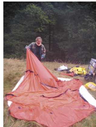
Aufbauarbeiten | nass schwieriger