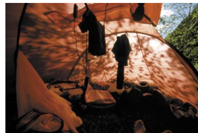
Innenansichten | Hilleberg Nallo 4 GT